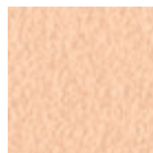
Metallo rosa cipria