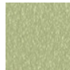
Metallo verde salvia