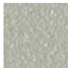
Metallo grigio chiaro