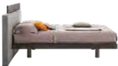
Testiera Halifax N.B.: Ring non incluso